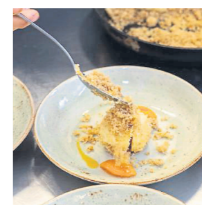
Anrichten Die fertig gegarten Knödel mit dem Schaumlöffel aus dem Wasser heben und in den gerösteten Zuckerbröseln wälzen.