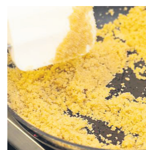
Butterbrösel Eine Pfanne erhitzen und die Butter darin aufschäumen. Die Semmelbrösel mit dem Puderzucker und Vanillezucker zu der Butter geben.