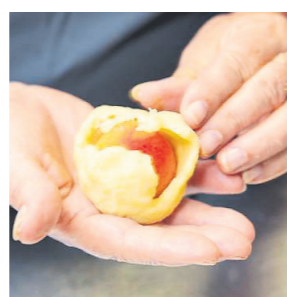
Knödel formen Die Teigscheiben platt drücken und die entkernten und mit Würfelzucker gefüllten Marillen darauflegen und zu Knödel formen.