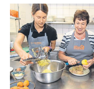
Knödelteig herstellen Die Kartoffeln noch heiß schälen und ca. zehn Minuten ausdampfen lassen. Durch eine Kartoffelpresse in eine Schüssel drücken.

Tipp: Die Marillen sind fertig, wenn sie schön weich sind. Zitronenschale entfernen. Die Marillen heiß in ein Einweckglas einfüllen und verschließen.