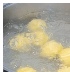
Knödel kochen In kochendes Salzwasser einlegen, zwei Minuten köcheln und weitere 25 Minuten bei schwacher Hitze ziehen lassen.