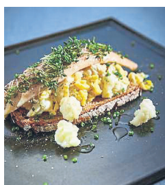
Bodenständig: Fisch mit Rührei.

100 g weiche Butter 2 Eier 200 g Hartweizengrieß Salz und Pfeffer aus der Mühle frisch geriebene Muskatnuss