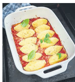
Vegetarisch: Nockerl auf Tomatensauce.