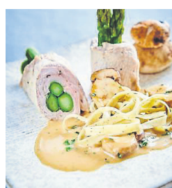
Besonders: Gefüllte Kalbsschnitzel.

Masse mit Salz, Pfeffer und Muskatnuss würzen.