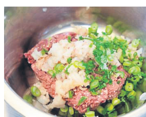
Die Füllung besteht aus Schweinehack und Garnelen, asiatisch gewürzt.