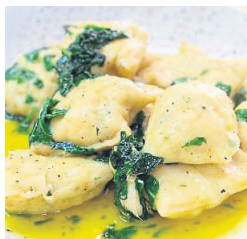
Asiatisch ist die Füllung gewürzt.

Darm entfernen, Garnelen fein hacken und zum Schweinehack geben. 4. Die Lauchzwiebelwürfel in etwas Sesamöl ohne Farbe anbraten, Korianderwurzel dazugeben; mit Sojasoße und Mirin ablöschen. Den Ingwer fein reiben und in die Soße geben; auskühlen lassen. Chilischote und Limettenblättern fein schneiden und mit Lauchzwiebelröllchen zum Hackfleisch geben. Masse mit Fischesauce, Salz und Pfeffer abschmecken. Den Frühlingszwiebelud dazugeben, durchrühren, ca. 1 Std. kühl stellen. 5. Garnelenschalen in Öl scharf anbraten, Schalotten hacken, Knoblauch anknacksen und zu den Garnelenschalen geben. Mit dem Cognac ablöschen und mit einem halben Liter Wasser aufgießen. Bei wenig Hitze eine halbe Stunde köcheln lassen; durch ein feines Sieb passieren. 6. In der Zwischenzeit den Kartoffelteilig machen: Die Kartoffeln noch heiß schälen und durch eine Kartoffelpresse in eine Schüssel drücken. Das Eigelb, eine Prise Salz, Speisestärke, Mehl und die weiche Butter dazugeben und kräftig verkneten. 7. Teig und Masse jeweils halbieren. 8. Den Teig ca. ½ cm dick ausrollen. Die Garnelen-Schweinehackmasse ca. einen Fingerbreit vom Rand entfernt sowie einen Fingerbreit links und rechts auf dem Kartoffelteilig verteilen. Den Teig der Länge nach zusammenfalten, dass ein circa 5 cm breiter Strudel entsteht. Die beiden Enden mit Hilfe des Stiels eines Kochlöffels zusammendrücken. Nun ca. alle 5 cm mit dem Kochlöffelstiel den Teig abdrücken und mit einem Messer durchschneiden.