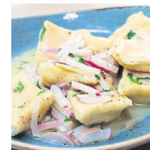
Knackig: mit Radieserl gefüllt.

Räucheraal von Haut und Gräten befreien und in kleine Würfel schneiden. 2 Radieserl erst in Scheiben, dann in Würfel schneiden. Schnittlauch in feine Röllchen schneiden. Schnittkäse mit dem Eigelb cremig rühren. Den Aal, Radieserlwürfel, die Hälfte vom Schnittlauch und die Hälfte vom Meerrettich in den Käse geben und vorsichtig unterheben. Mit Salz, Pfeffer und Cayennepfeffer abschmecken. Mit Nussbutter und klein geschnittenen Radieserln servieren.