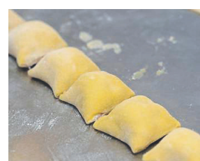
Mit dem Kochlöffel fünf Zentimeter große Taschen abtrennen.