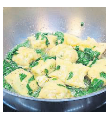
Nur der Spinat ist hier klassisch.

Alles zusammen mit Hilfe einer Rührmaschine zu einem glatten Teig verarbeiten. In eine Folie einpacken und für ca. 30 Min. kühl stellen.