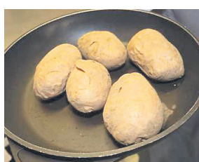
Für den Kartoffelteilig: Kartoffeln im Ofen eine Stunde backen.