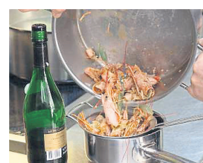
Aus den Garnelenschalen einen Fond kochen. Mit Cognac aufgießen.