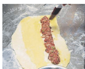
Den Teig ca. ½ cm dick ausrollen. Die Schweinehackmasse darauf geben.